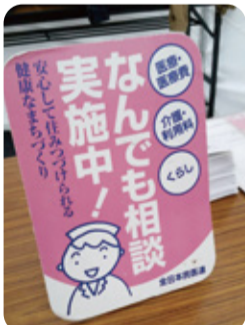
▲毎月、中野共立病院・診療所有志の皆さんと