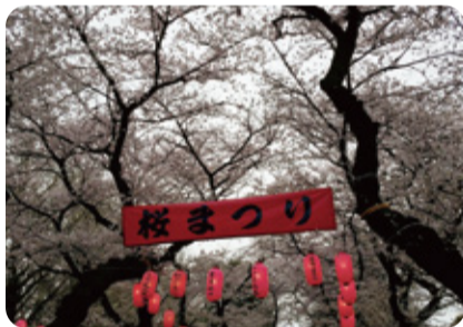
▲桜が満開のもとでの開催