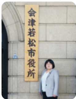
▲福島県喜多方市・会津若松市へ