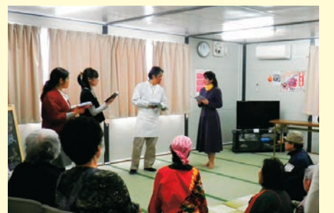
▲第3次支援では劇団「じゃけん」による芝居提供