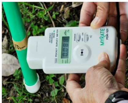
写真：(左) 放射線量測定器