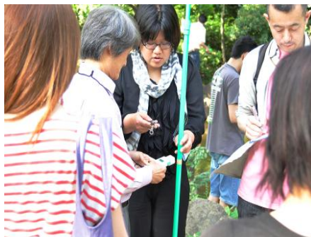
(中央) 平和の森公園での測定の様子